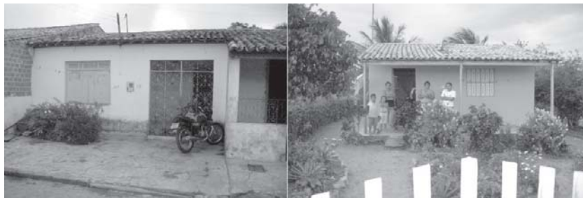
Visitas às famílias de candidatos ao Programa Residência Universitária.

mília ou de renda familiar equivalente; e) diferentemente de anos anteriores em que predominavam alunos matriculados nos cursos de Licenciatura (Geografia, História, Matemática Letras, entre outros), tem crescido o número de alunos matriculados em cursos considerados “nobres”, a exemplo de Odontologia, Direito e Engenharia Elétrica; f) as visitas domiciliares efetuadas pela equipe técnica da Coordenação de Assistência e Integração do Estudante (CODAE), durante o processo de seleção dos candidatos às vagas dos Núcleos Residenciais, têm demonstrado mais do que um mecanismo de controle, uma vez que elas estabelecem um primeiro elo da relação entre os alunos, familiares e a equipe. Nas fotos a seguir registramos algumas residências visitadas em municípios do interior sergipano e alguns Núcleos Residenciais do Programa.