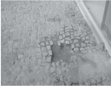
Foto 3: piso de acesso à reitoria. Além de trepidante, danificado.