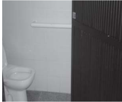
Foto 2: Sanitário fora da norma da ABNT. Porta abrindo para dentro.