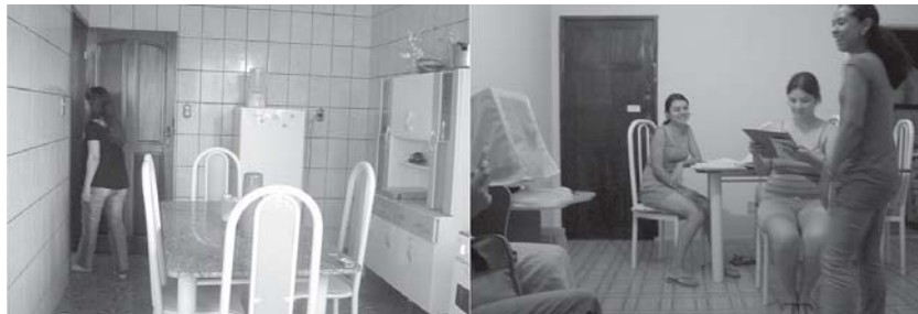
Visitas aos Núcleos Residenciais do Programa Foto - Marlemberg, arquivo CODAE, 2009.